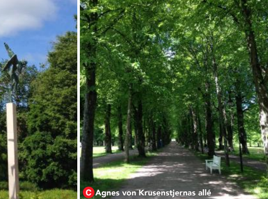
C Agnes von Krusenstjernas allé