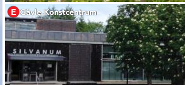
E Gävle Konstcentrum