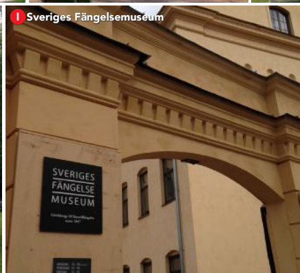
I Sveriges Fängelsemuseum