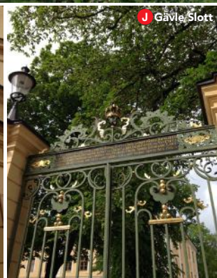
J Gävle Slott