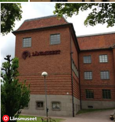
O Läns museet