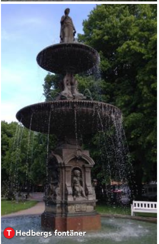
T Hedbergs fontäner