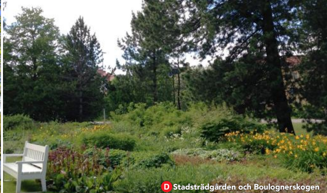
D Stadsträdgården och Boulognerskogen