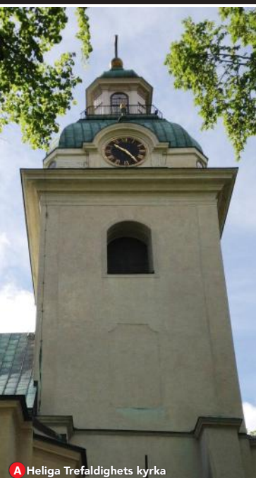
A Heliga Trefaldighets kyrka

Text till stadsvandringen kan hämtas på Gävle Turistcenter. Tfn: 026-177117