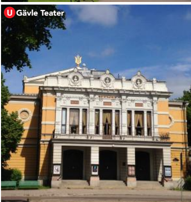
U Gävle Teater