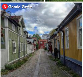
N Gamla Gefle