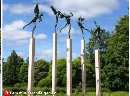
B Fem musicerande genier