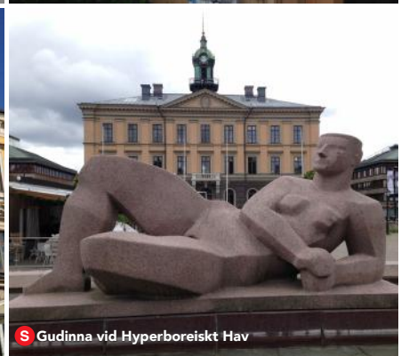
S Gudinna vid Hyperboreiskt Hav