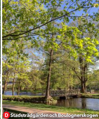
D Stadsträdgården och Boulognerskogen