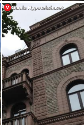
V Gamla Hypotekshuset