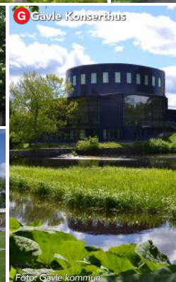
G Gävle Konserthus