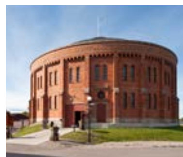
Kapacitet: < 450 bankett