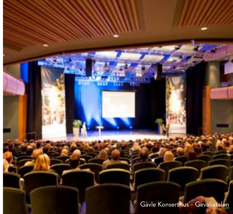
Gävle Konserthus - Gevaliasalen